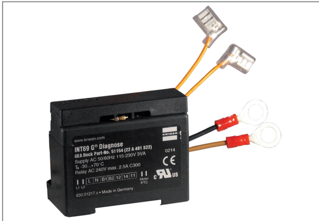
INT69 G Diagnostic